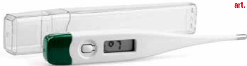
TERMOMETRO DIGITALE art. TERMO