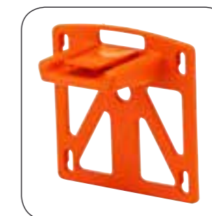
SUPPORTO A MURO INCLUSO

dimensioni: 43x27,4x15 cm colore: arancio