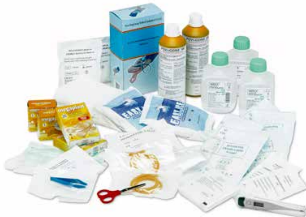
art. SCM091 allegato 1 base senza mis. pressione

Allegato 2 (fino 2 persone): guanti sterili monouso (2 paia), flacone di soluzione cutanea di iodopovidone (10% di iodio) (125 ml), flacone di soluzione fisiologica (sodio cloruro 0,9%) da 250 ml (1), compresse di garza sterili 10x10 cm in buste singole (3), compresse di garza sterile 18x40 in buste singole (1), pinzette da medicazione sterili monouso (1), confezione di cotone idrofilo (1), confezione di cerotti di varie misure pronti all'uso (1), rotoli di cerotto alto 2,5 cm (1), rotolo di benda orlata alta 10 cm (1), un paio di forbici, laccio emostatico (1), ghiaccio pronto uso (1), sacchetto monouso per la raccolta di rifiuti sanitari (1).