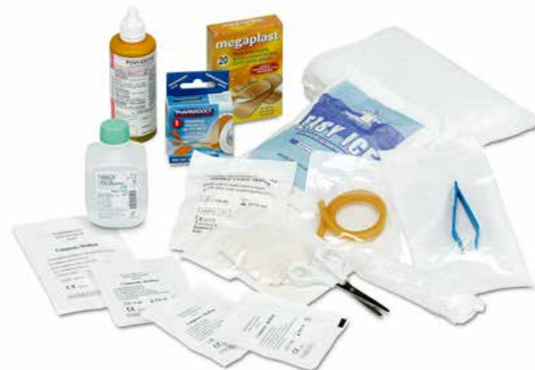
art. SCM094 allegato 2 maggiorato