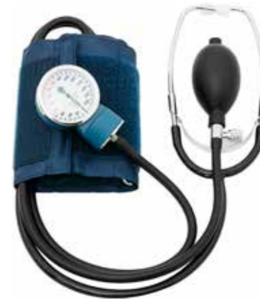
SFIGMOMANOMETRO ANEROIDE art. SCM7003 con fonendoscopio