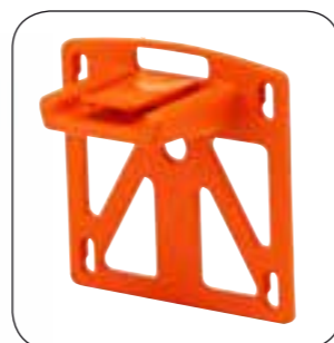
SUPPORTO A MURO INCLUSO