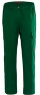
51 - BOTTLE GREEN

Etichetta jacquard con pittogrammi cucita e travette varie di colore rosso.