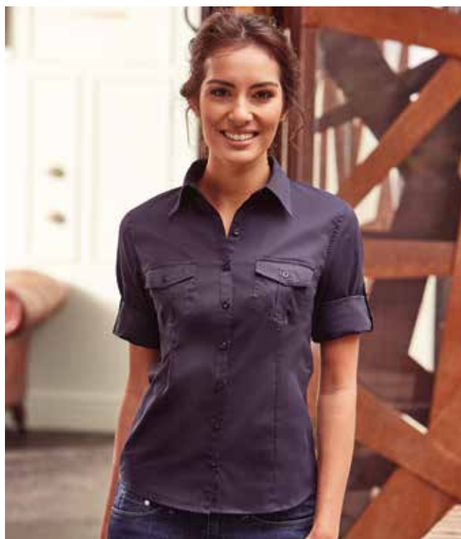
RU918F DONNA - MANICA A 3/4 XS - S - M - L - XL - XXL