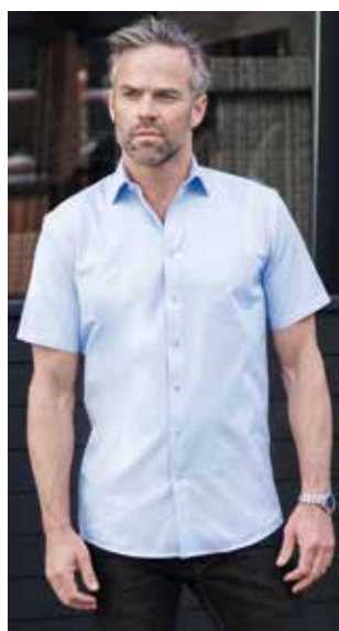
RU973M UOMO MANICA CORTA S - M - L - XL - XXL - 3XL - 4XL