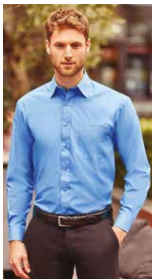
RU934M UOMO MANICA LUNGA S - M - L - XL - XXL - 3XL - 4XL