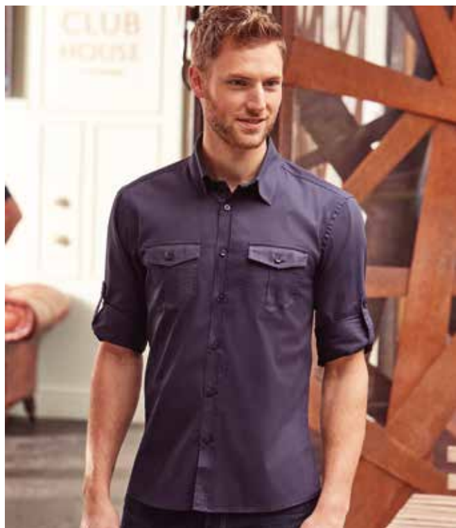
RU918M UOMO MANICA LUNGA S - M - L - XL - XXL - 3XL - 4XL