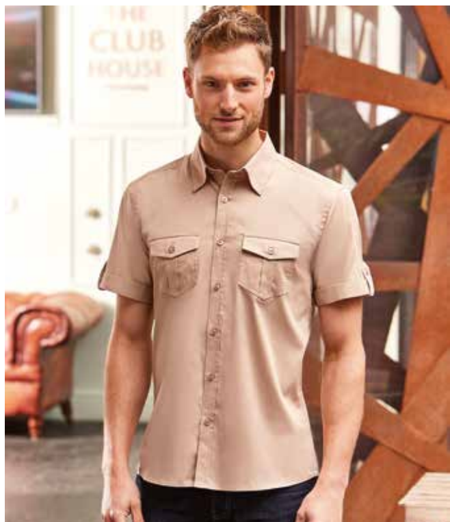
RU919M UOMO MANICA CORTA S - M - L - XL - XXL - 3XL - 4XL