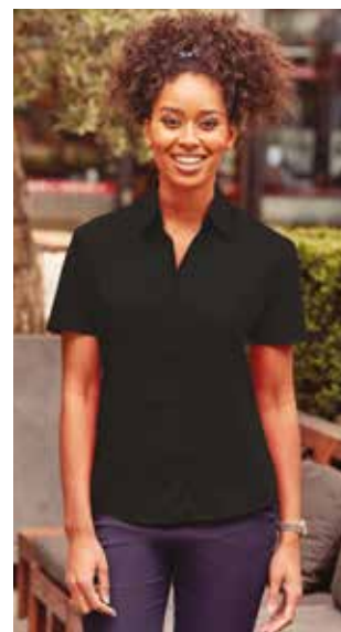
RU935F DONNA MANICA CORTA XS - S - M - L - XL - XXL