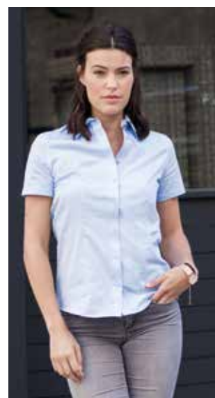
RU973F DONNA MANICA CORTA XS - S - M - L - XL - XXL