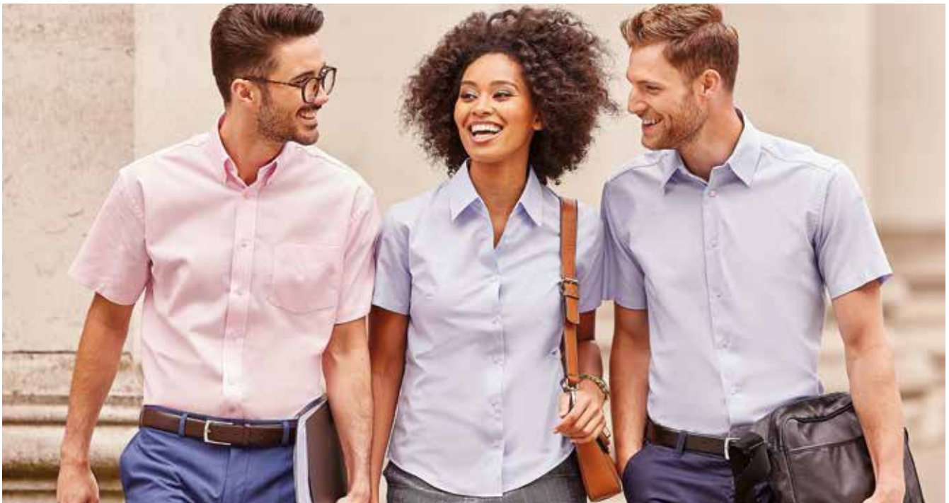
RU933M UOMO MANICA CORTA S - M - L - XL - XXL - 3XL - 4XL - 5XL - 6XL