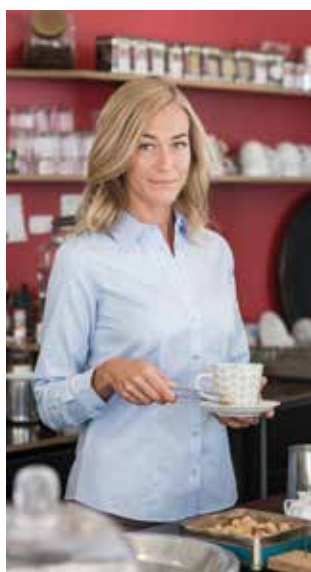
RU972F DONNA MANICA LUNGA XS - S - M - L - XL - XXL