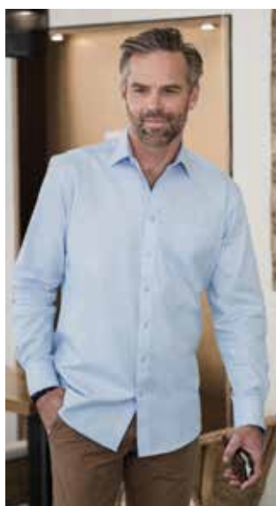
RU972M UOMO MANICA LUNGA S - M - L - XL - XXL - 3XL - 4XL

105 g/m 2 • (White 110 g/m 2 ) 70% cotone / 30% poliestere Coolmax®. Su misura. Colletto rigido New Kent rinforzato. Traspirabilità e regolazione dell'umidità grazie alla tecnologia in fibra Coolmax®. Micro-Twill durevole. Carré posteriore con 2 pieghe laterali. Tasca sul petto sinistra. Orlo curvo. Versione a maniche lunghe: polsini regolabili con 2 bottoni.