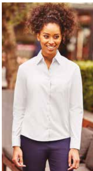
RU934F DONNA MANICA LUNGA XS - S - M - L - XL - XXL