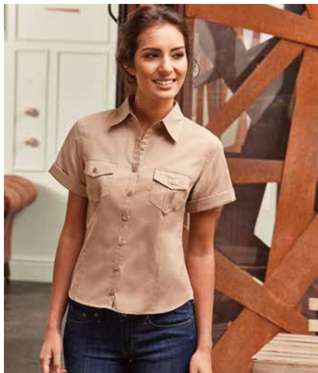
RU919F DONNA MANICA CORTA XS - S - M - L - XL - XXL