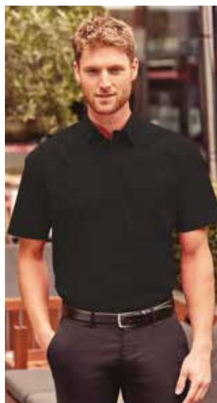
RU935M UOMO MANICA CORTA S - M - L - XL - XXL - 3XL - 4XL