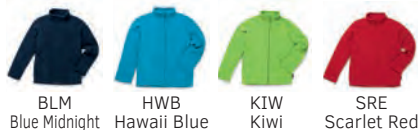
BLM Blue Midnight HWB Hawaii Blue KIW Kiwi SRE Scarlet Red

100% Poliestere - 220 gr/m 2 Micro pile con fissaggio antipilling - Traspirante - Lavabile a 40° Cuciture laterali - Garzata ambilaterale Nastro di rinforzo collo in poliestere saia Mezzaluna - 2 tasche laterali - Collo alto Cerniera tono su tono con finitura inferiore per bottoni