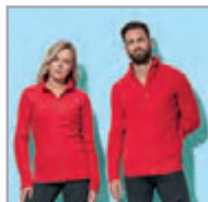
ST5030 ST5100 PAG. 313